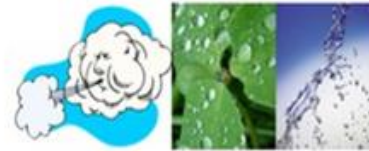
ბუნებრივი (ქარი, წვიმა) და ადამიანის მიერ წარმოქმნილი დაზიანებები