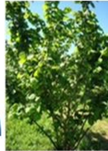
მასპინძელი მცენარის ინფიცირება (ბაგეების და ჭრილობის გზით)