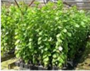
ინფიცირებული მცენარეული მასალა (ნაკლებ სიმპტომური)