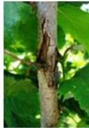
იარა, სადაც ბაქტერია გამოიზამთრებს