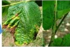
დაავადებული ფოთოლი და ღეროები