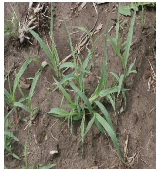
გლერტა - Cynodon dactylon ( L. ) Pers